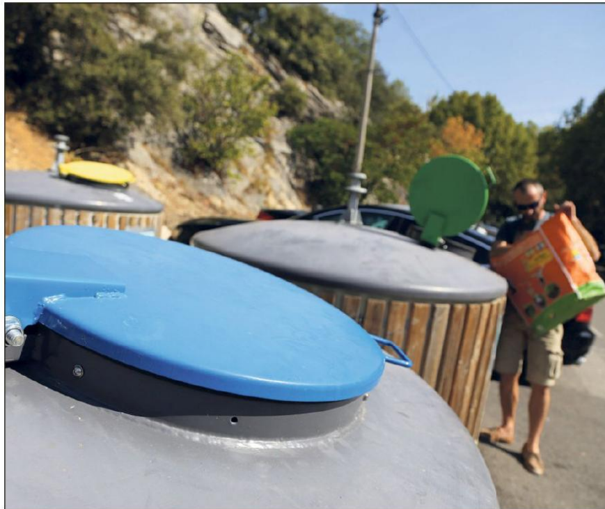
Le but du Sived est de diminuer le nombre de déchets générés par les foyers.